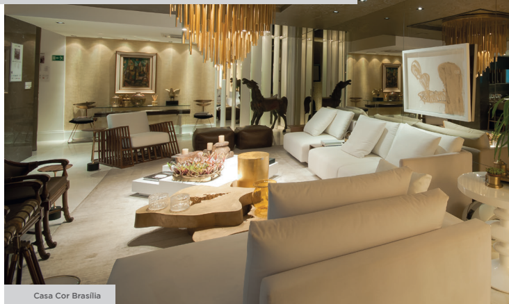
Casa Cor Brasília

Perfeitos para os mais sofisticados projetos, os espelhos Cebrace tornam qualquer ambiente mais amplo, moderno e requintado, inspirando aplicações que acompanham as tendências mundiais da arquitetura e do design de interiores.